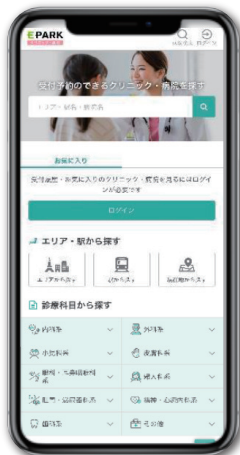
※イメージ画像です