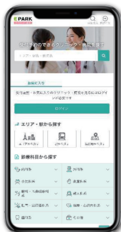
※イメージ画像です